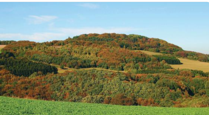
2 PANORAMA Perler Kopf